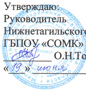
ГРАФИК РАБОТЫ ПРИЕМНОЙ КОМИССИИ НИЖНЕТАГИЛЬСКОГО ФИЛИАЛА ГБПОУ «СОМК»